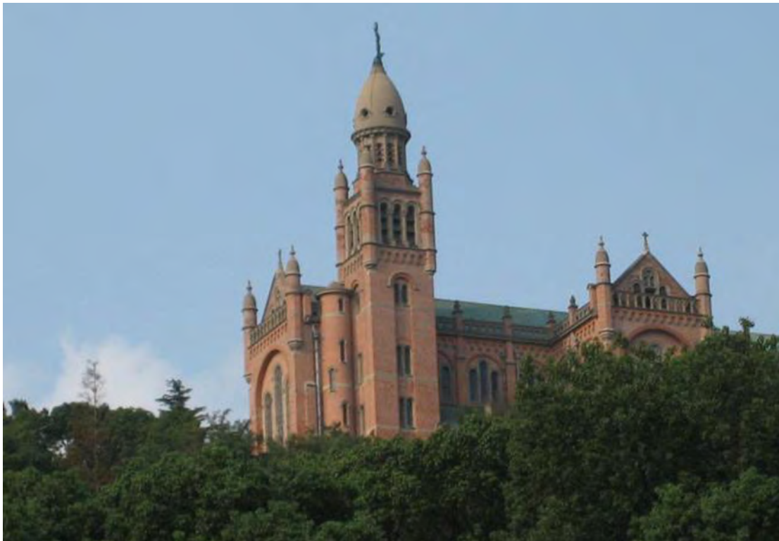
Marienbasilika auf dem Sheshan.

Quellen: Holy Spirit Study Centre (Hong Kong), Diözese Shanghai, Osservatore Romano , Interview China-Zentrum mit Bischof Jin.