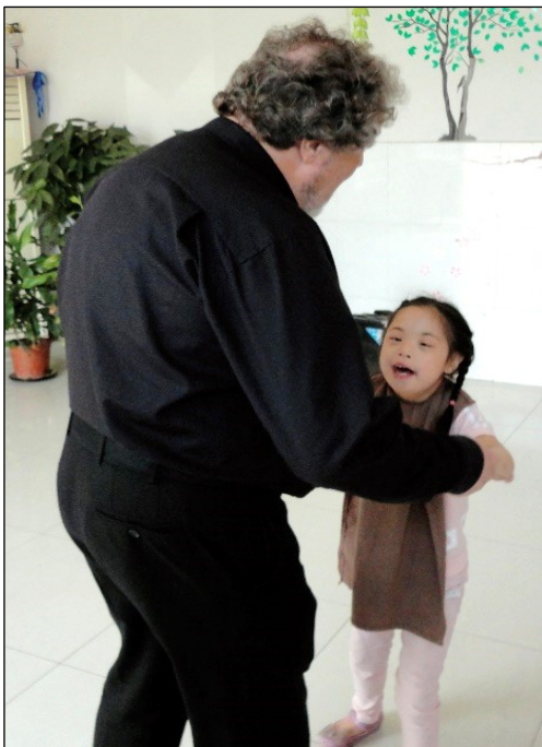
Weihbischof Steinhäuser

Als wir hörten, dass auch dieses Waisenheim jetzt von den chinesischen Behörden aufgelöst worden ist und alle Kinder auf staatliche Heime verteilt sind, da konnte man sich seiner eigenen Tränen kaum erwehren, aber Freudentränen waren es diesmal nicht!