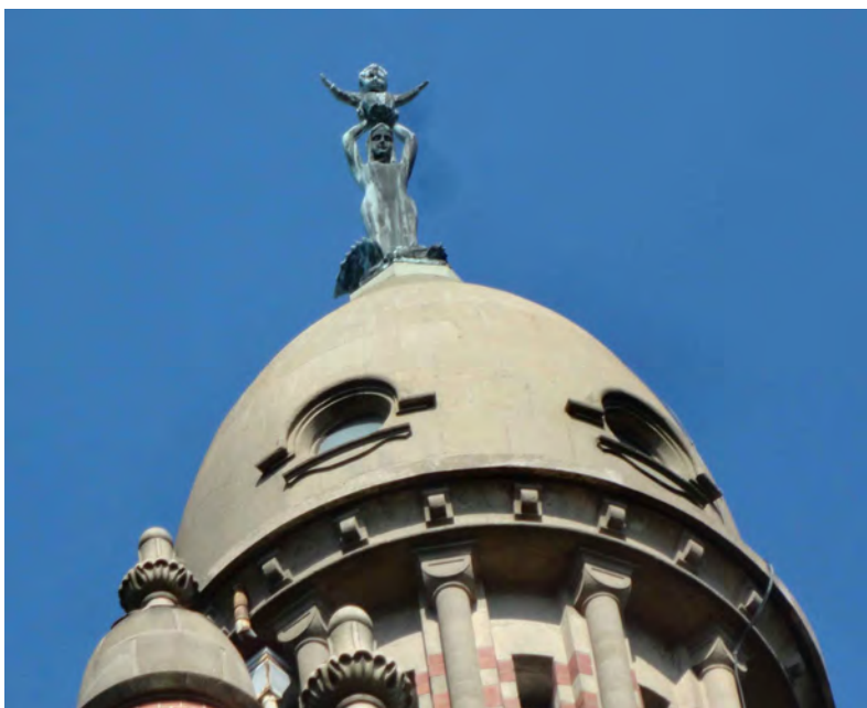
Muttergottes mit Jesus auf der Marienbasilika von Sheshan.

Im Jahre 1924 weihten die Bischöfe Chinas das Land der Muttergottes und pilgerten anschließend zum Sheshan. 1925 wurde mit dem Neubau der Marienbasilika auf dem Berggipfel begonnen, die zehn Jahre später eingeweiht werden konnte. Die Basilika hat einen 38 Meter hohen Turm, dessen Spitze eine Bronzestatue der Muttergottes trägt, die ihren Sohn Jesus in die Höhe hebt. Da dieser die Arme segnend ausbreitet, gleicht die Statue aus der Ferne einem großen Kreuz.